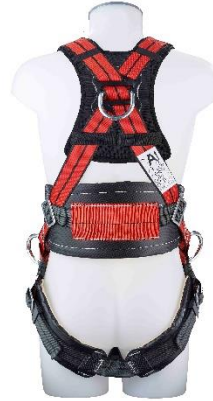
MAS 400 Rückansicht