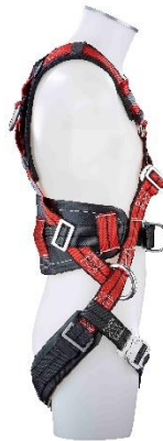
MAS 400 Seitenansicht