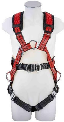
MAS 400 Vorderansicht