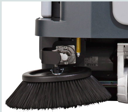
Het DustGuard™ vernevelingssysteem draagt bij aan stofvrij vegen zodat de omgeving zowel voor de bestuurder als voor de medewerkers verbeterd (optie)