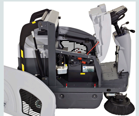
Het onderhoud is eenvoudig omdat voor het verwijderen van borstel en filter geen gereedschap nodig is en omdat de eenvoudige toegang tot alle onderdelen voor snel en gemakkelijk onderhoud zorgen