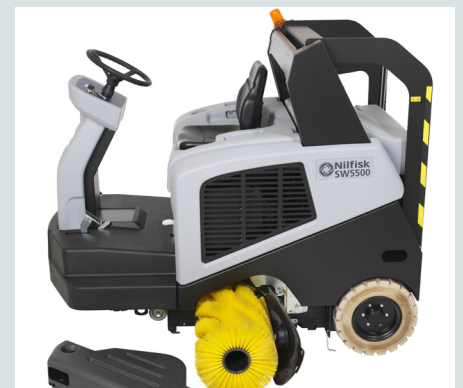
De mogelijkheid tot het snel vervangen van de belangrijkste componenten vereenvoudigt het dagelijkse gebruik en voorkomt onnodige stilstand