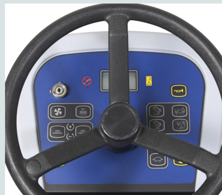
Bedieningspaneel met pictogramtoetsen en een modern display voor gebruiksgemak dat het beste is in zijn klasse